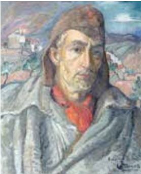
Portrait de profil