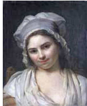
Portrait de trois quart