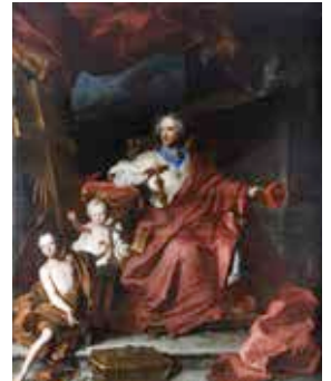
Portrait de face